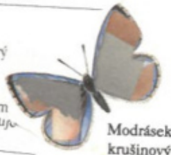
Modrásek krušinový (samec)

cu, která je v bičíkem. NI který in vištěm putu- u. z, který se pělému