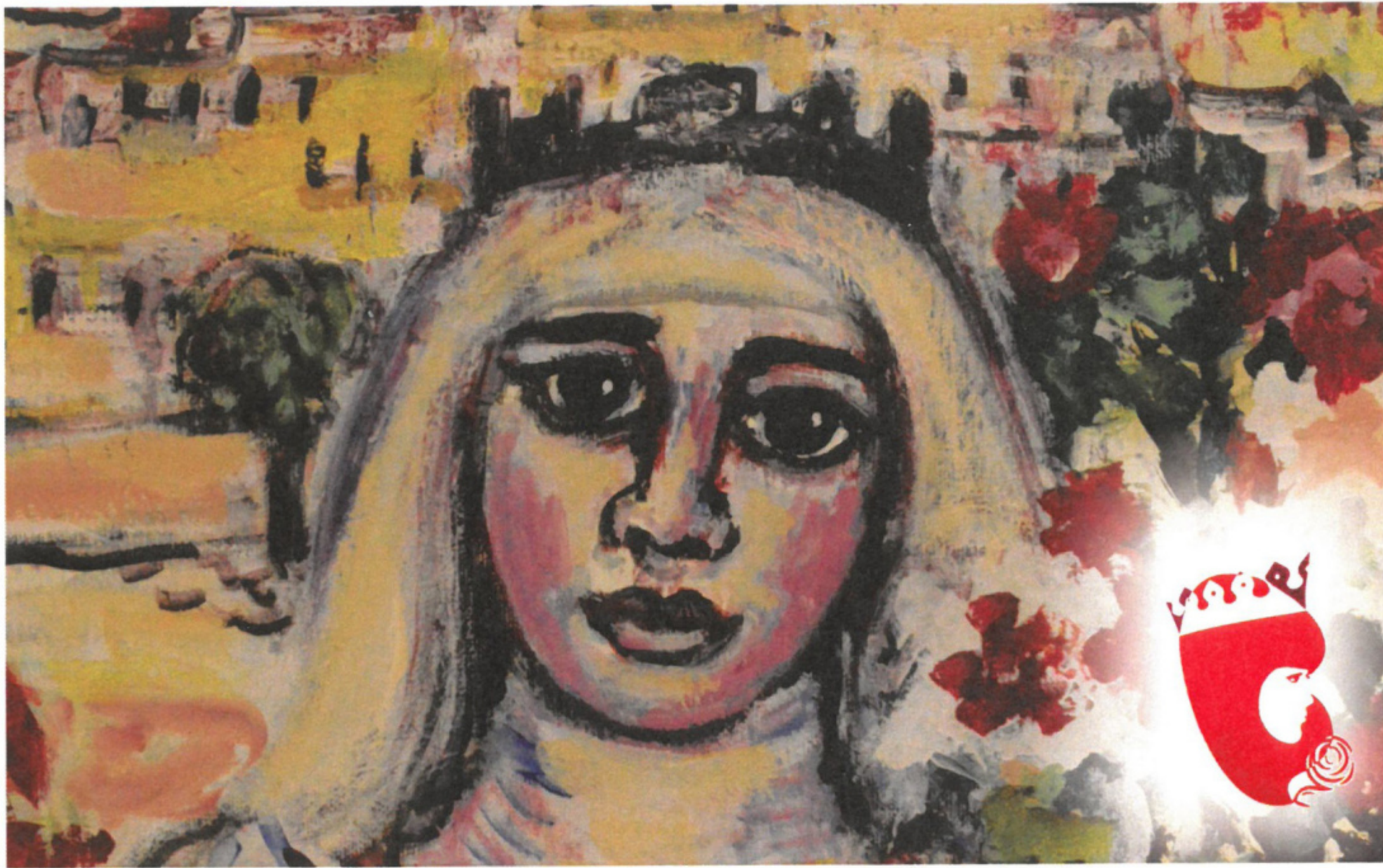
Recordatório Rainha Santa Isabel/Alfredo Bastos - Posto de Turismo