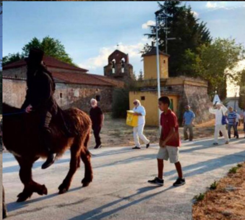
desfile de la comitiva al cementerio del arte.