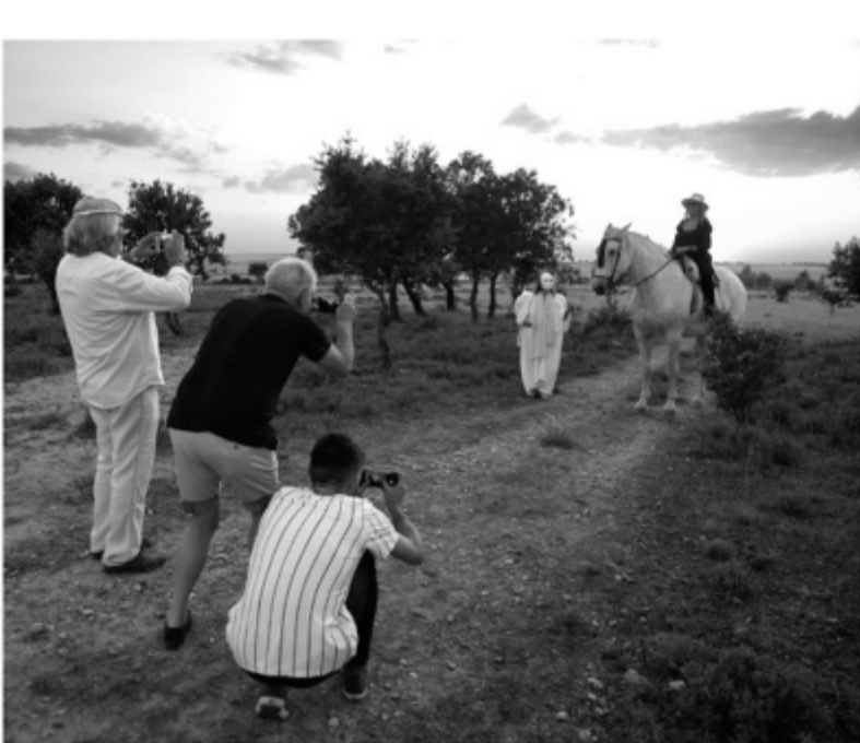
Os fotógrafos são uns chatos do pior...