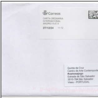
QC.2025.ACERVO.0008 PRJ A