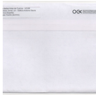
QC.2025.ACERVO.0008 PRJ A