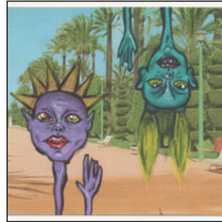
QC.2025.ACERVO.0008 PRJ 002