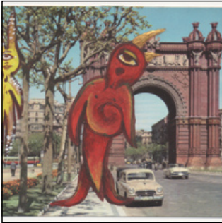
QC.2025.ACERVO.0008 PRJ 001

tinta sobre postal > 103 x 148 mm tinta sobre postal > 103 x 148 mm envelope > 121 x 176 mm outro > 297 x 210 mm outro > 297 x 210 mm 2025