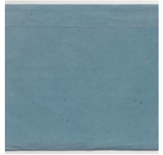
QC.2025.ACERVO.0002 PRJ A