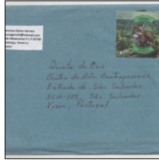
QC.2025.ACERVO.0002 PRJ A