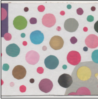
QC.2025.ACERVO.0002 PRJ 001

colagem > 116 x 161 mm envelope > 129 x 174 mm 2025