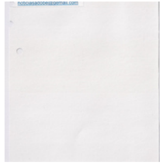
QC.2022.ACERVO.0021 PRJ 001