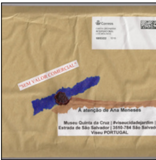
QC.2022.ACERVO.0021 PRJ A