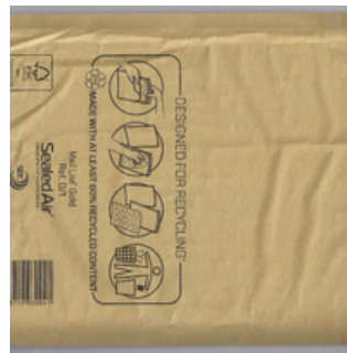
QC.2022.ACERVO.0021 PRJ A