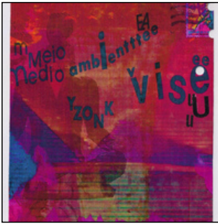
QC.2022.ACERVO.0021 PRJ 001

técnica mista > 180 x 129 mm técnica mista > 180 x 129 mm envelope > 200 x 268 mm 2022