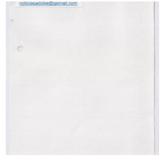
QC.2022.ACERVO.0021 PRJ 002