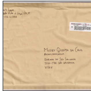
QC.2022.ACERVO.0001 PRJ A