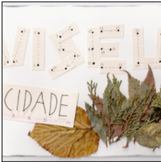
QC.2022.ACERVO.0001 PRJ 001

técnica mista > 175 x 260 mm envelope > 250 x 350 mm outro > 297 x 210 mm 2022