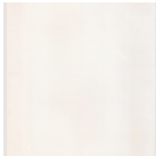
QC.2022.ACERVO.0001 PRJ B