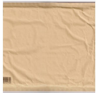
QC.2022.ACERVO.0001 PRJ A